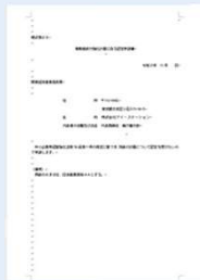
事業継続力強化計画策定