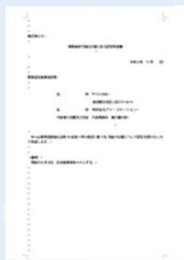
事業継続力強化計画策定