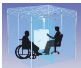
▲感染症対策クリーン面会ブース設置イメージ