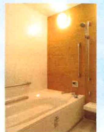
ユニットバス UB 個人浴も完備しております。