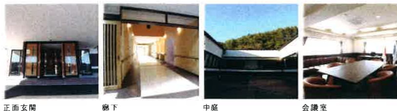
正面玄関 廊下 中庭 会議室