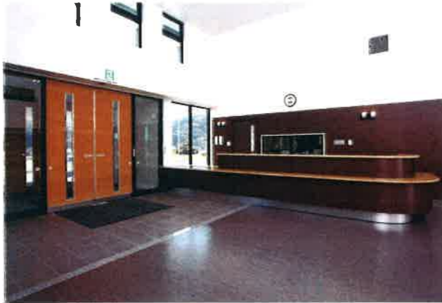
受付 Acceptance 広い受付は、交流スペースとしてもご利用いただけます。

特別養護老人ホームかわうちは、常時介護を必要としている高齢者が、これまでの住み慣れた地域で生活を送ることができるようにと設立された、定員80名の地域密着型 特別養護老人ホームです。