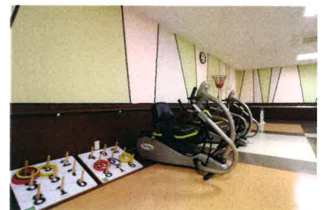
リハビリスペース Rehabilitation space マシンを使つての機能訓練も行えます。