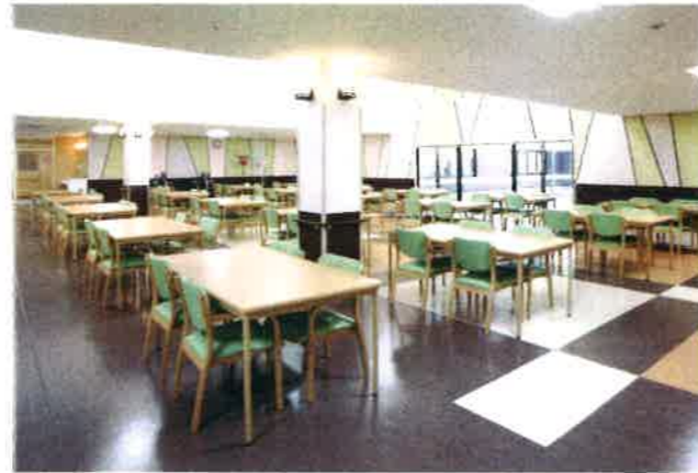
食堂 Dining hall 日当りの良い広々とした食堂では、入所者が揃って食事を召し上がっていただけます。