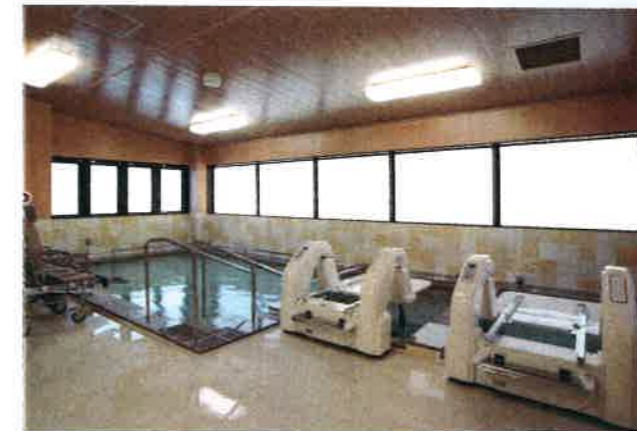
浴室 Bathroom 一般浴槽のほか、特殊浴槽も備え、身体の状態に合わせた入浴スタイルを選ぶことができます。