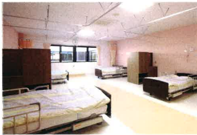
居室 Living room お部屋ごとに壁紙やカーテンの色を変え、明るい居住スペースをつくっています。