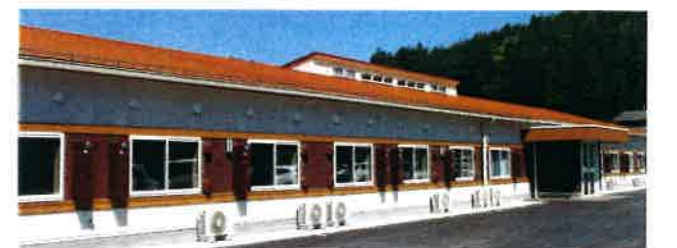
職員宿舎 Staff quarters 施設隣接の宿舎です。