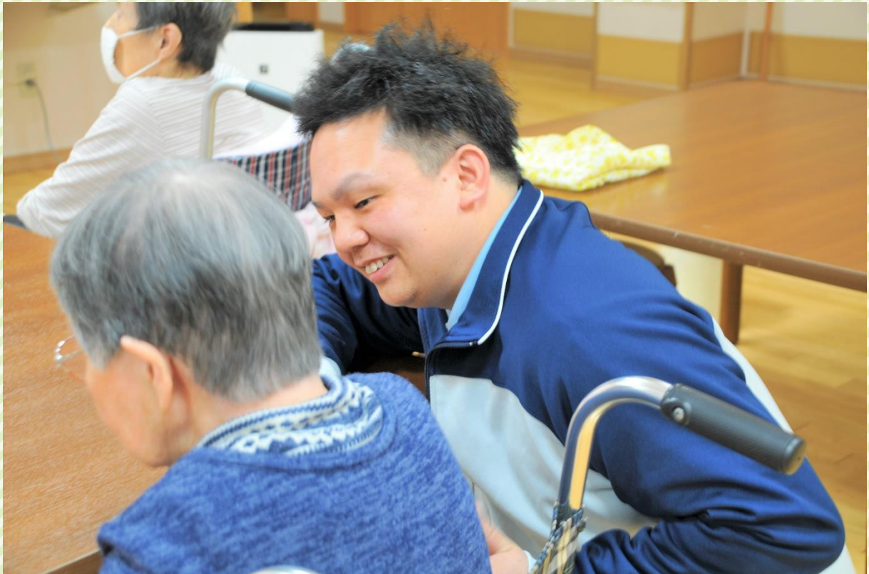
※令和元年以前に撮影された写真です。