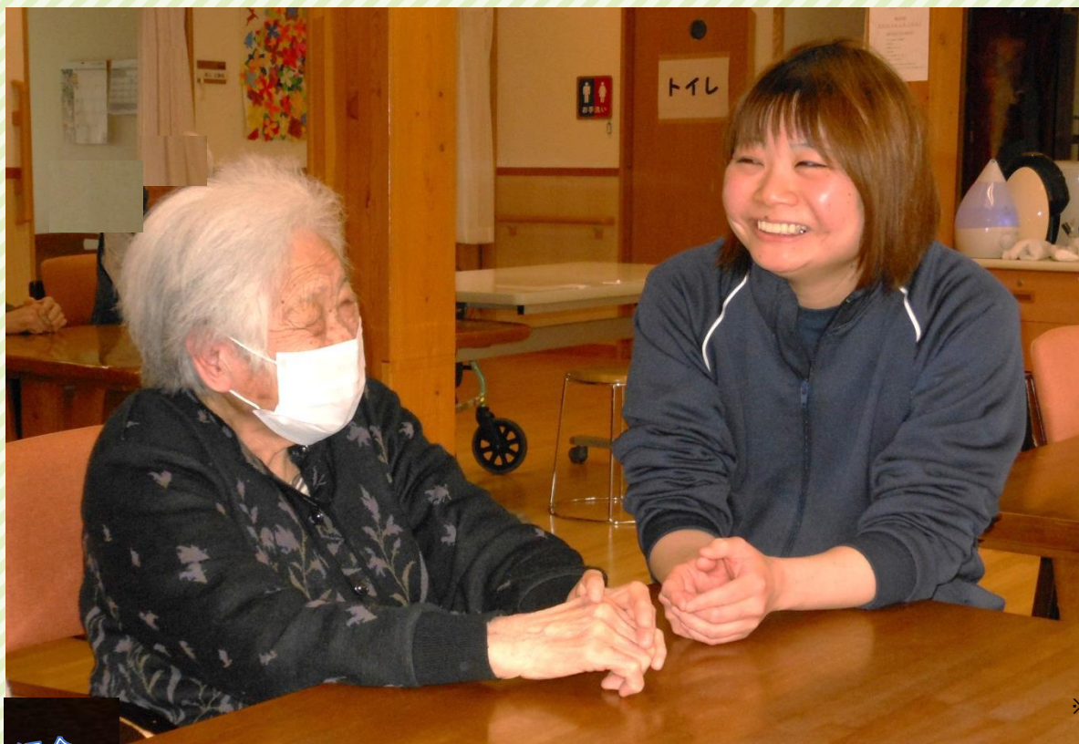
※令和元年以前に撮影された写真です。