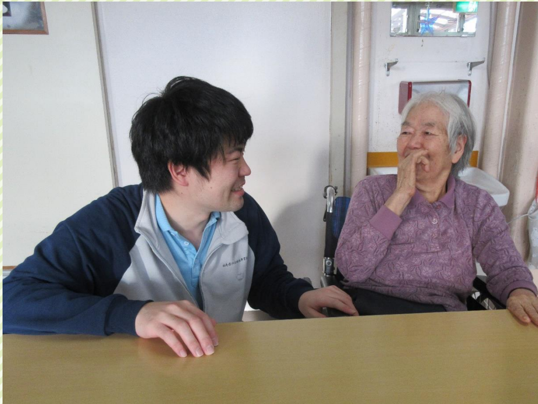
※令和元年以前に撮影された写真です。