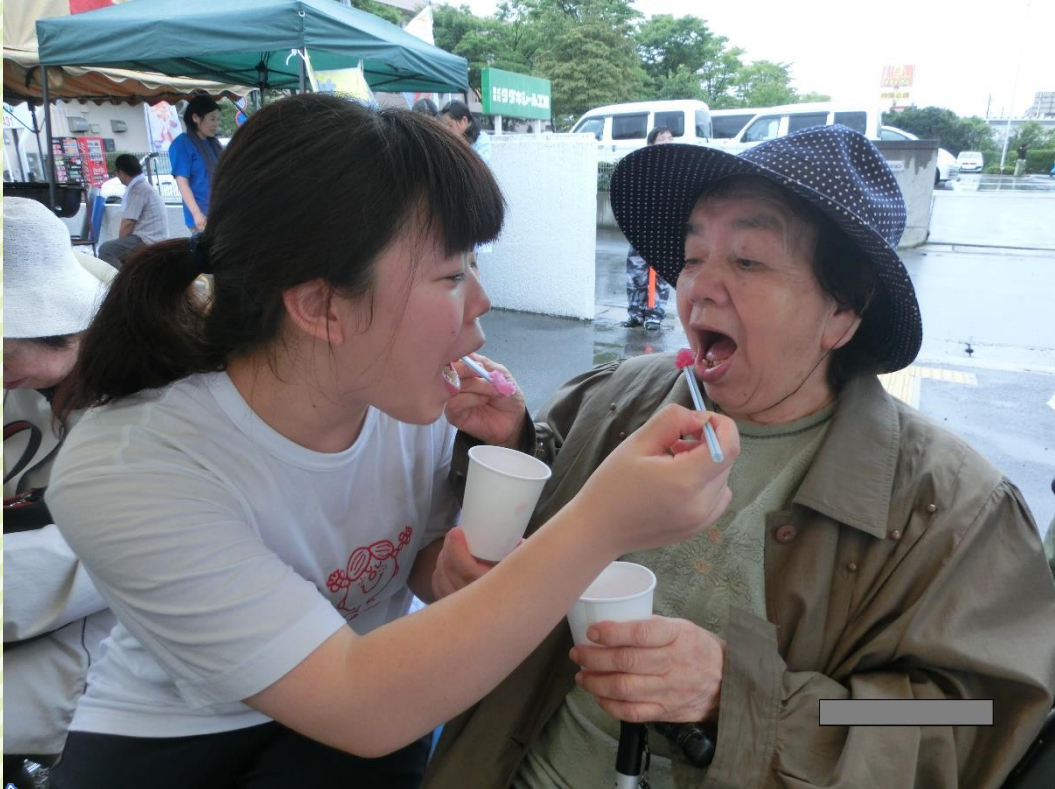
※令和元年以前に撮影された写真です。