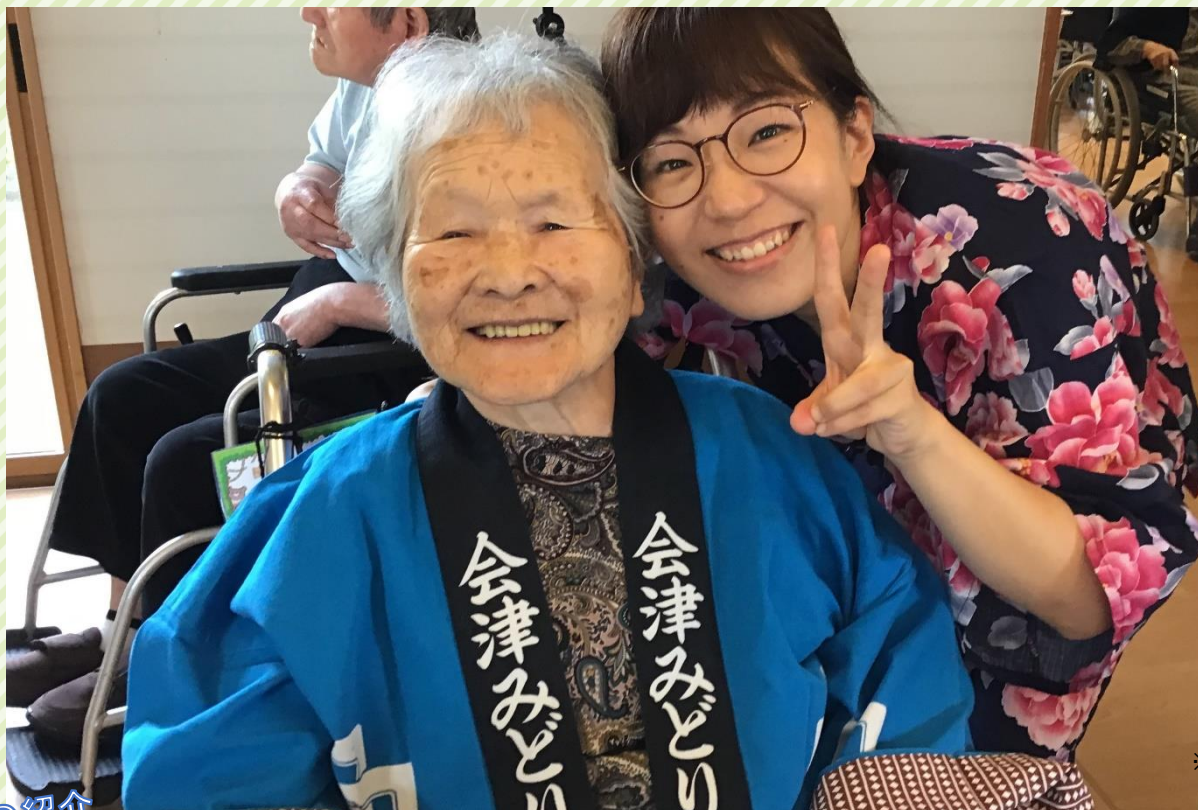
※令和元年以前に撮影された写真です。