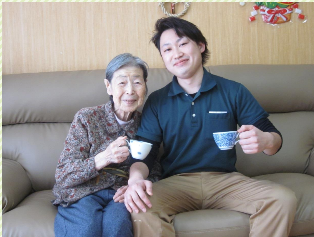
※令和元年以前に撮影された写真です。