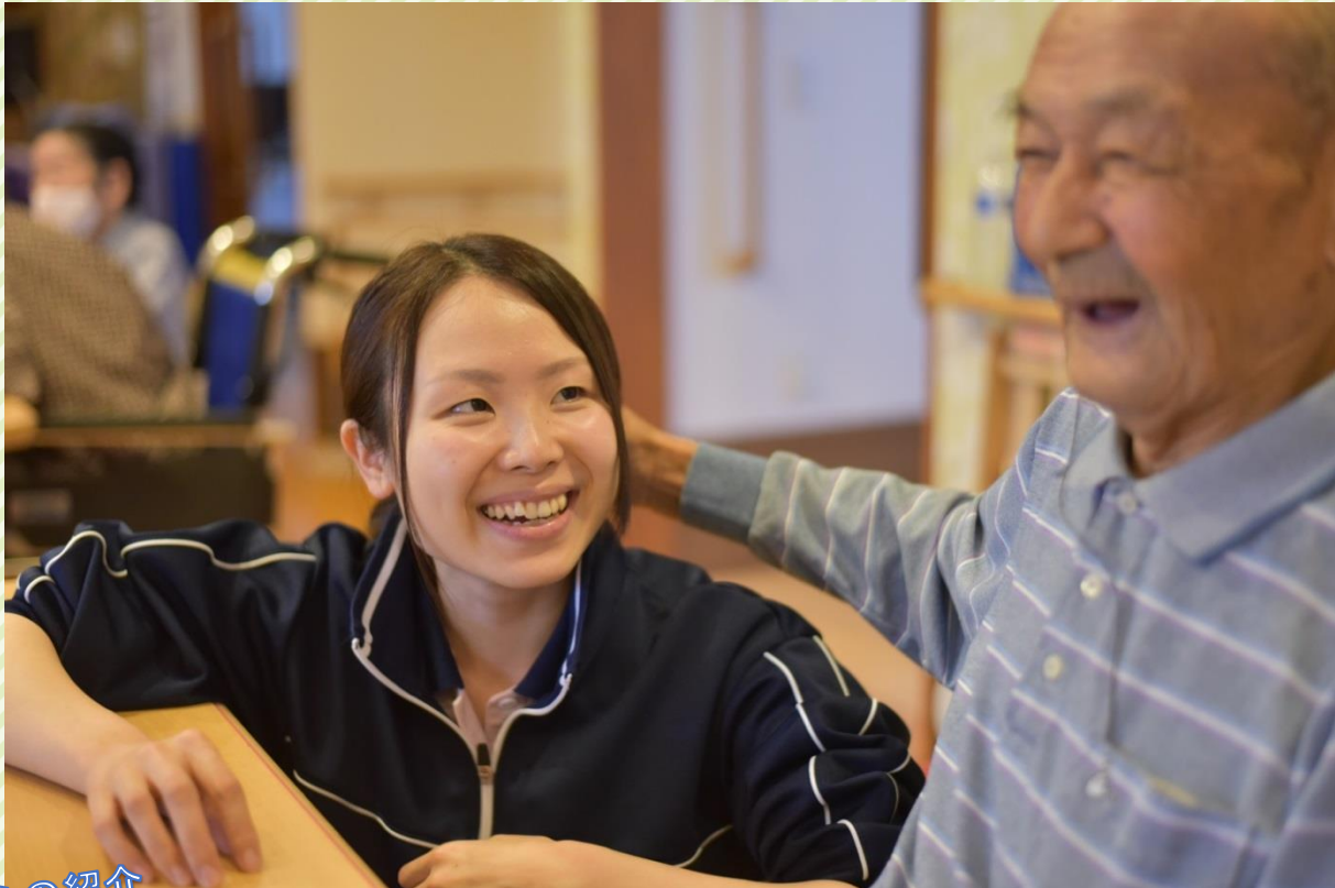
※令和元年以前に撮影された写真です。